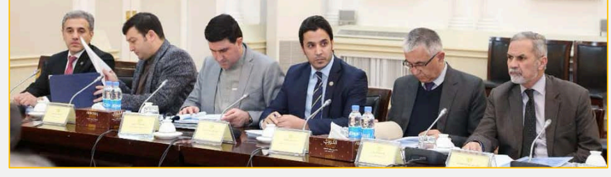
مقام دستر سالکار پروفیسور محمد همایون قیومی تر مشرکی لاندې په چارچتر مانی کې جوړه شوه.

د اقتصاد عالی شورا یوویستمه ناسته د لېنډی میاشتی پر لومړی نېټه د مالی وزارت د سرپرست او د ولسمشری عالی