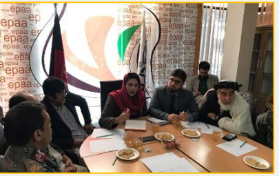
گردیده تا مشکلات اموال صادراتی کشور به طور بنیادی حل گردد.