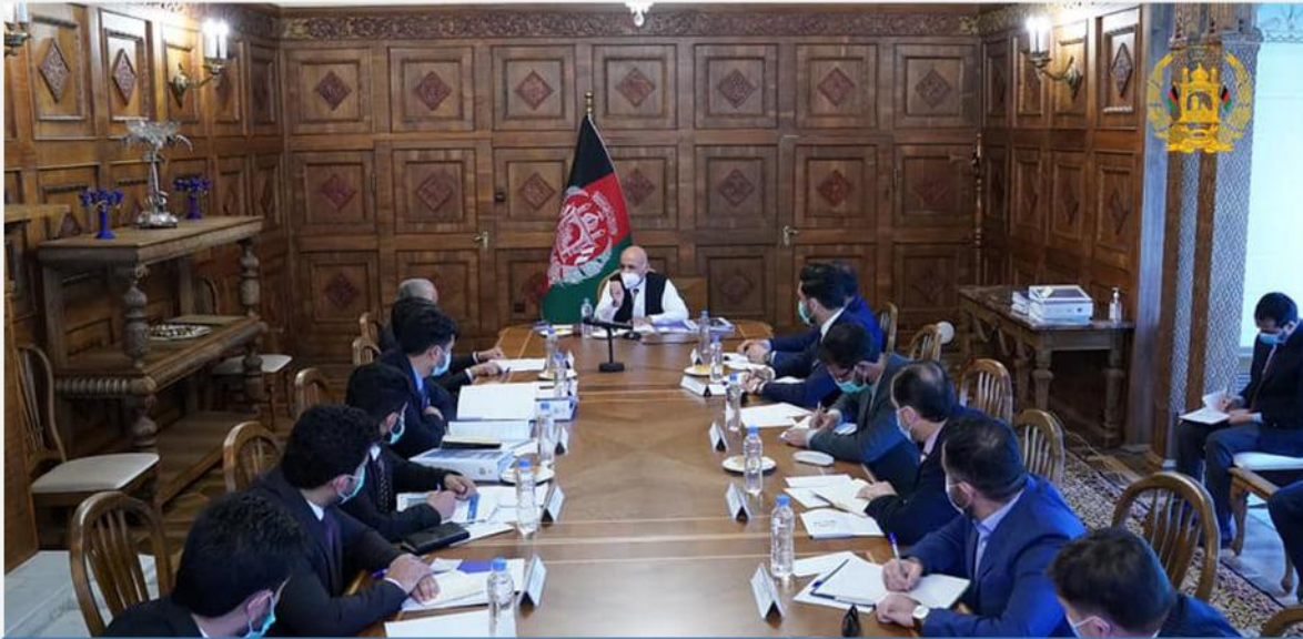
نشست رئیس جمهور با هیات رهبری وزارت صنعت و تجارت