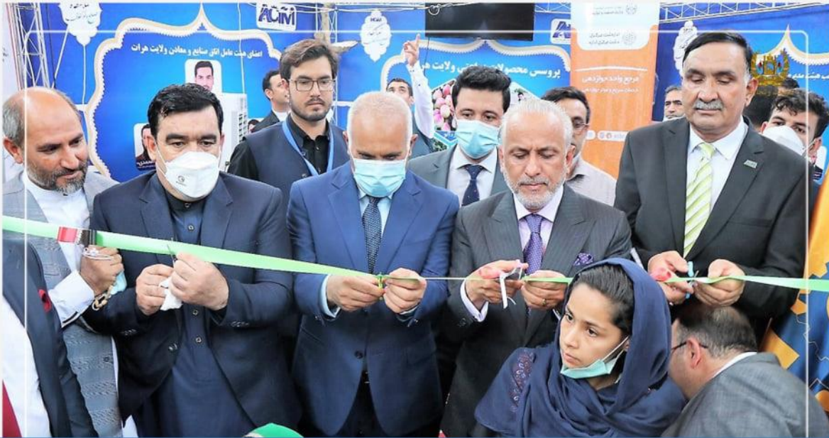
افتتاح مرکز واحد طی مراحل اسناد محصولات صادراتی در ولایت هرات