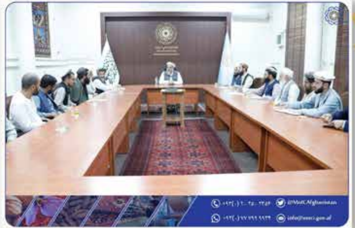
دیدار وزیر صنعت و تجارت با تجار ولایت پکتیا