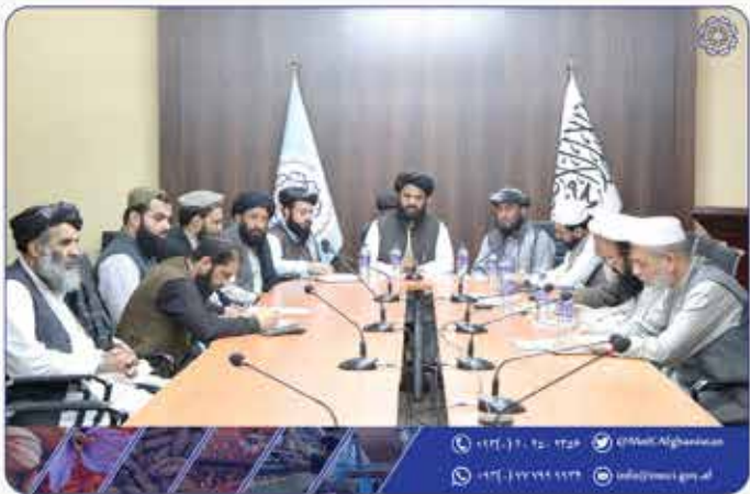
جلسه‌ی آنلاین رؤسای و آمرین ولایات تحت رهبری محترم مولوی قدرت‌الله جمال معین وزارت صنعت و تجارت