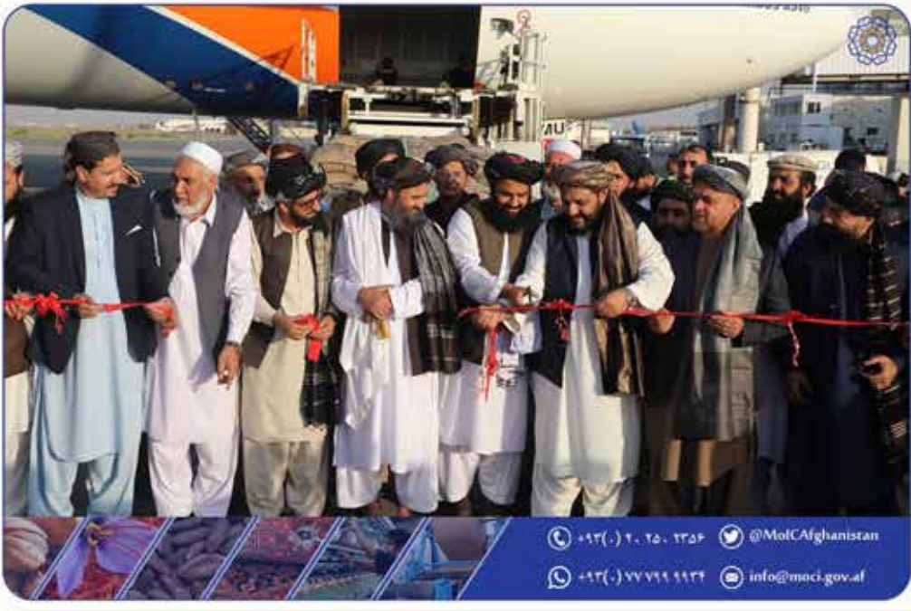
یک محموله ۲۰ تنی جلفوزه به ارزش نیممیلیون دالر به کشور چین صادر شد