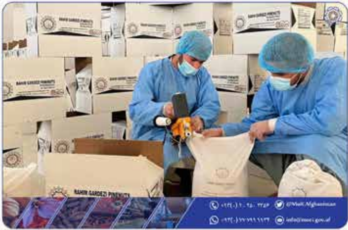
۸ اثن مغز جلفوزه به ارزش ۶۰۰ هزار دالر آمریکایی به کشور ایتالیا صادر گردد.