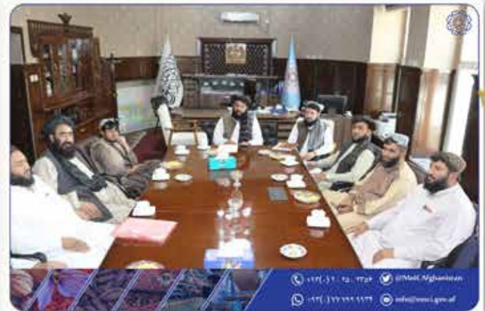
د هلمند ولایت له سوداګرو سره لیدنه