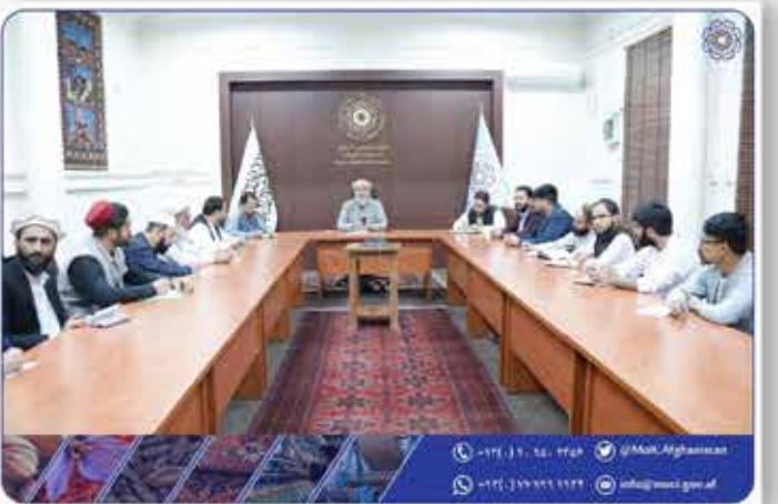
محترم الحاج نورالدین عزیزى وزیر صنعت و تجارت با تعدادی از اعضای اتاق صنایع و معادن افغانستان دیدار کرد.